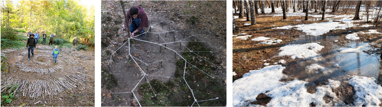
Ulike eksempler av bygde installasjoner i skogen: 1. Bruk av greiner for å lage en spiral. 2. Bruk av tau for å vise røttene til et tre. 3. Et vannhull i bakken i en bjorkeskog.

Et rom i skogen kan defineres som et avgrenset område i det åpne, naturlige miljøet som mennesker kan oppleve og bruke. Dette rommet kan variere i størrelse og ha forskjellige egenskaper, og det kan være formet av naturlige elementer som vegetasjon, steinformasjoner, snø, is og topografi, blant annet. I denne oppgaven ønsker vi å se din evne til å skape en estetisk opplevelse av et rom i skogen ved å bruke naturlige elementer fra stedet eller biologisk nedbrytbart materiale.